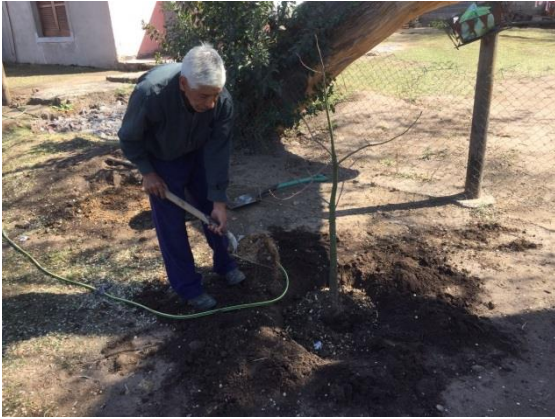
5/ vecino al que se le realizó entrevista