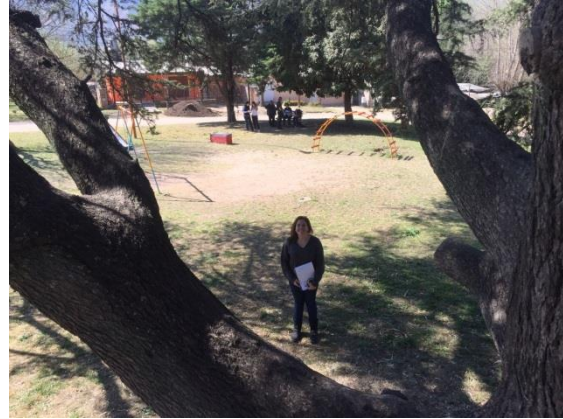
6/ estudiantes relevando la vegetación de un espacio público