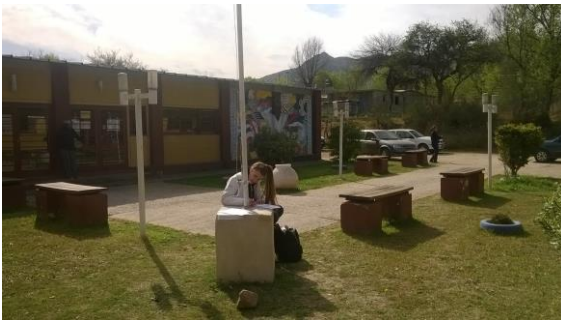
Relevamiento en el CIC