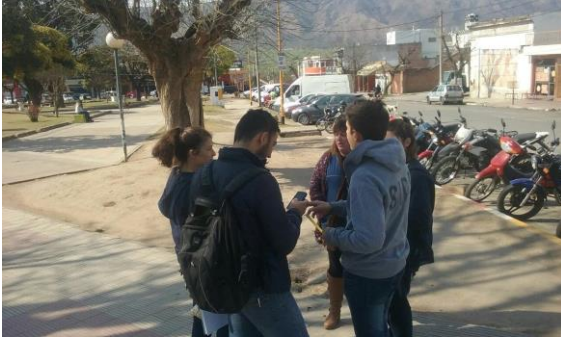
relevamiento en la Plaza san Martín