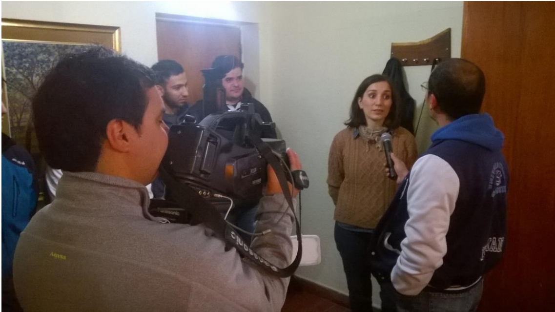
1/ entrevista a un medio local