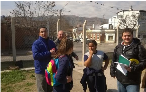
Relevamiento en el Andén