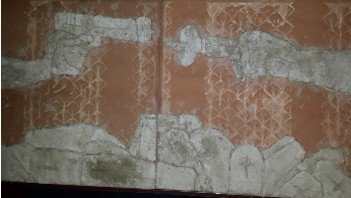
una composición de dos cerámicas representando la violencia