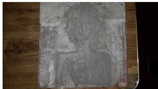
los derechos de la mujer. El bien y el mal.