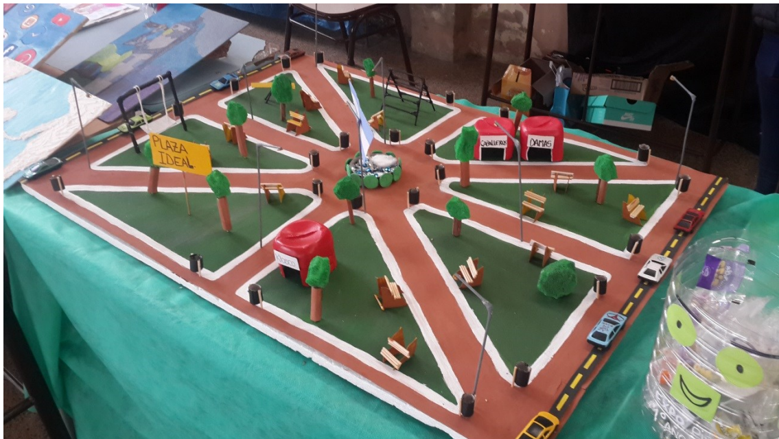
La maqueta principal

En este apartado del informe adjuntamos las imágenes correspondientes a la Propuesta de la Plaza ideal.