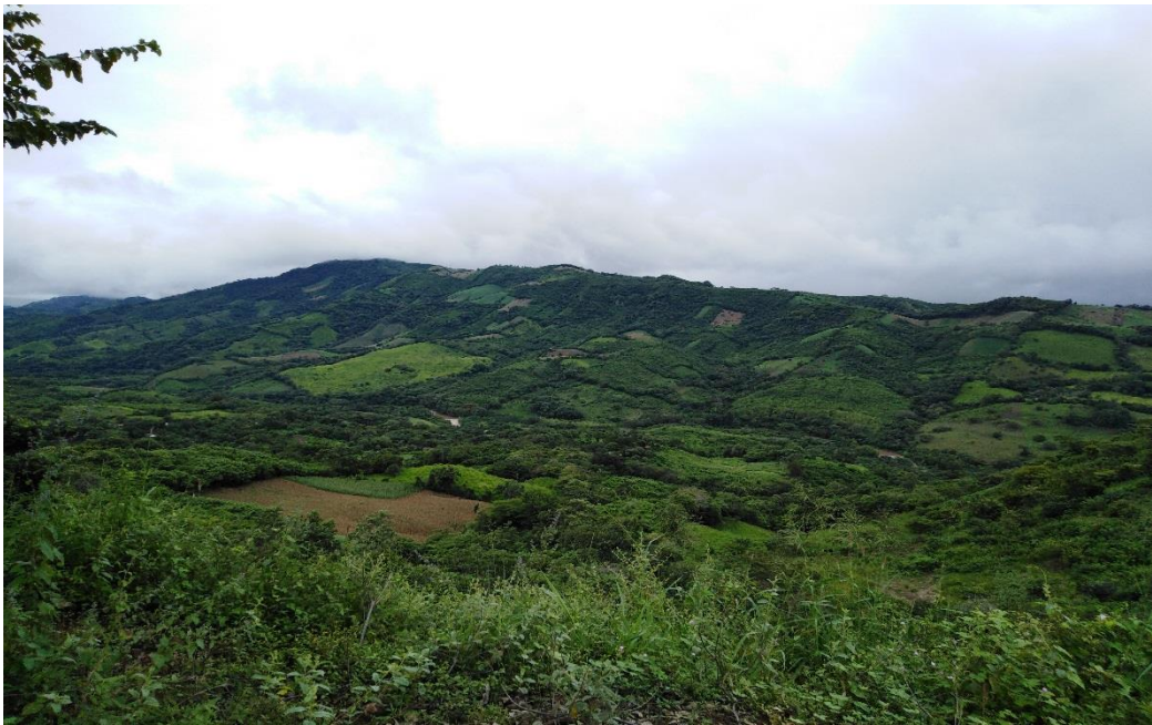
Domingo 07 octubre de 2018