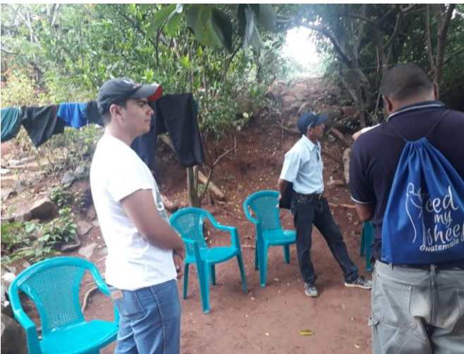
Sábado 06 octubre de 2018